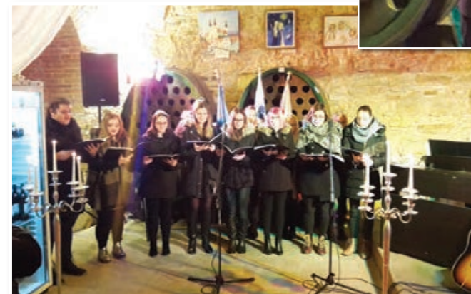
Vokalna skupina Vox Angelica