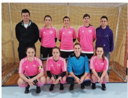
KMN Slovenske gorice

Lestvica po 7. krogu: 1. KMN Slovenske gorice (19) , 2. ŽNK Celje (14), 3. Siliko Nova panorama (4), 4. ŽNK Cerkevjenjak (2).