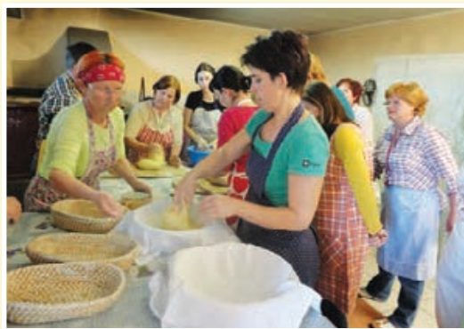
Delavnica Peka kruha