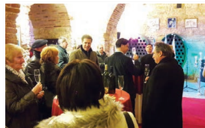
Po uradnem delu se je razvilo sproščeno srečanje.