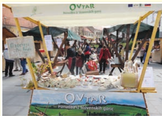
Velikonočni sejem 2012