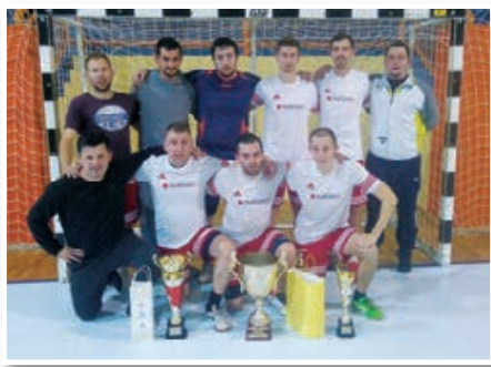
Zmagovalci memorialnega turnirja