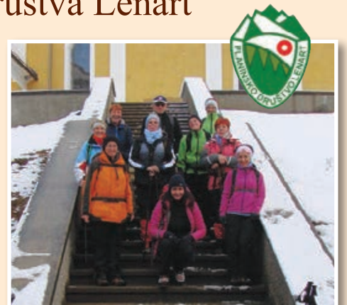
Gora Oljka - zaključni pohod v letu 2017