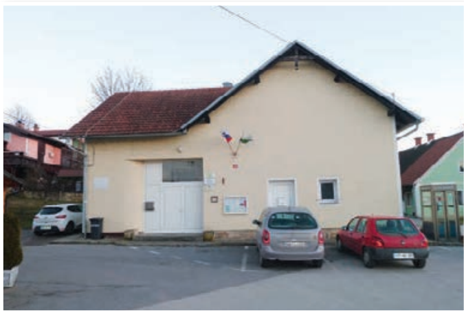
Dom kulture Benedikt

Iz programa kulture je razvidno, da je kulturna dejavnost v občini Benedikt zelo bogata in raznolika. Na področju institucionalne kulture delujejo v občini Javni sklad RS za kulturne dejavnosti – Območna izpostava Lenart, Knjižnica Lenart in Pokrajinski muzej Maribor.