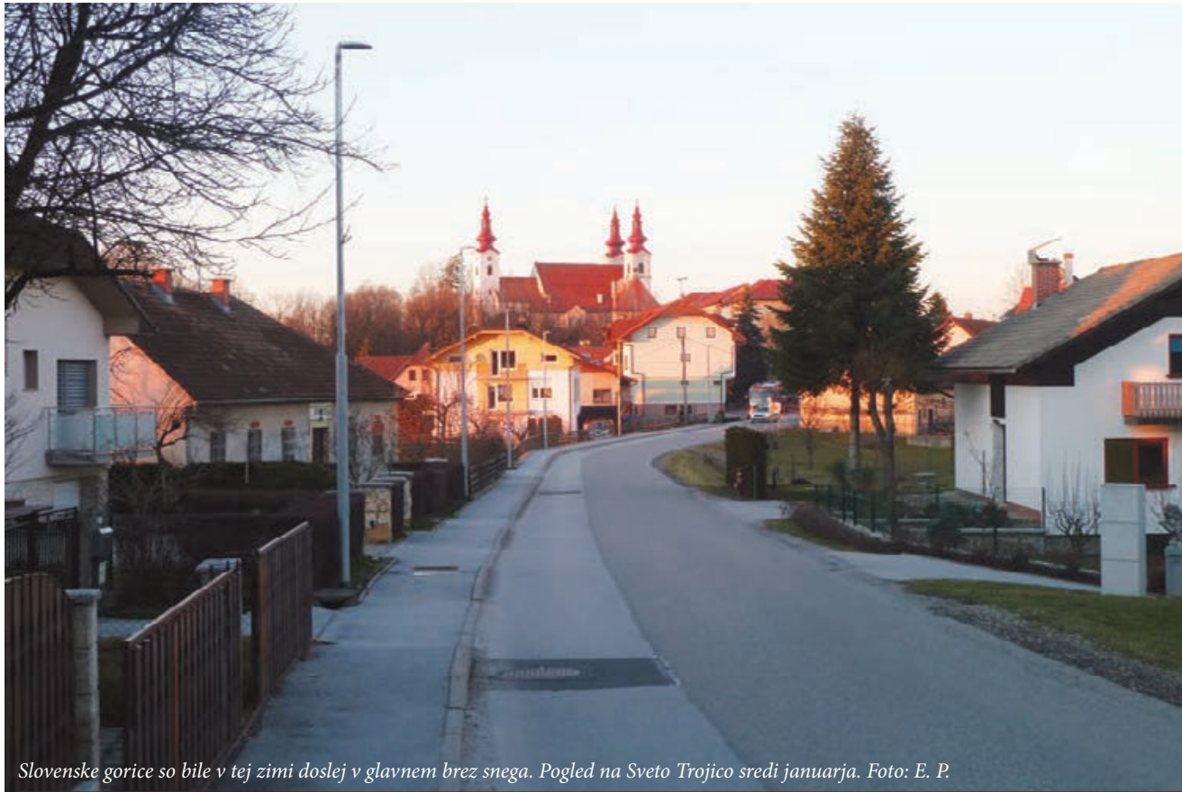
Slovenske gorice so bile v tej zimi doslej v glavnem brez snega. Pogled na Sveto Trojico sredi januarja.