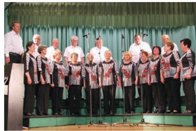
Mešani pevski zbor MDI Lenart z lanskega nastopa na Orfejevi pesmi