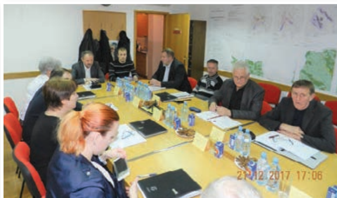
Jurovski svetniki na 22. redni seji sprejeli proračun za leto 2018